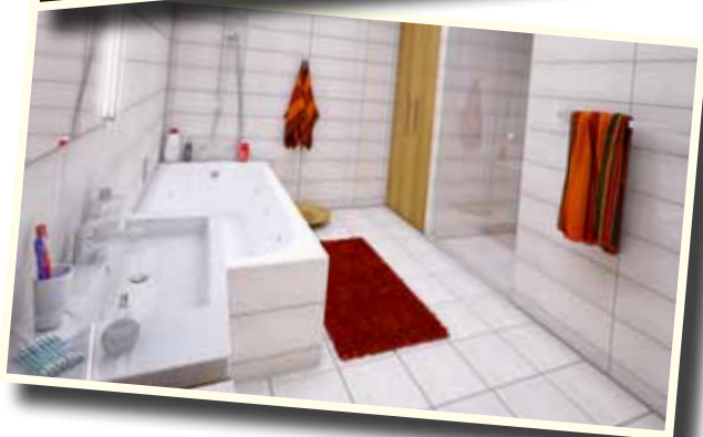
Použité ilustrace jsou pouze ilustrační.