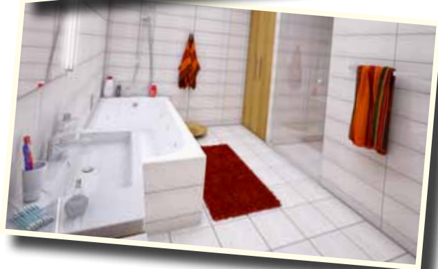
Použité ilustrace jsou pouze ilustrační.